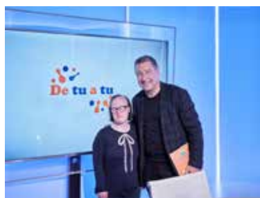
Joan Roca - Xef del Celler de Can Roca