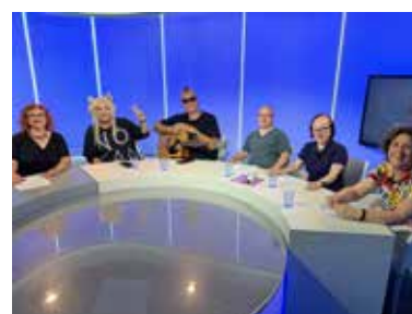
Grup musical Major Arcana