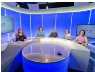
Pau - logurts Pauet